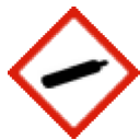
Cylindre de gaz